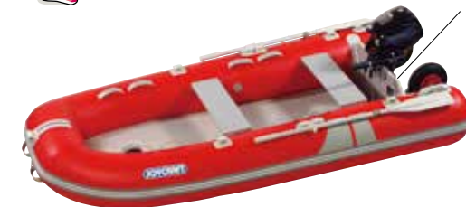
取り付け穴 標準装備 (一部除く)

女性でもエンジン付きボートを楽に安全に運搬可能。世界で最も簡単便利なボート運搬システムです。