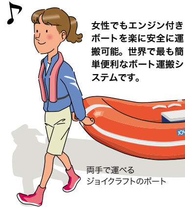
両手で運べる ジョイクラフトのボート

女性でもエンジン付きボートを楽に安全に運搬可能。世界で最も簡単便利なボート運搬システムです。