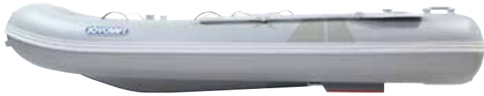
Grand 305 Side

A と B の計4個のリフティングハンドルは、2人でボートを運搬するときに非常に便利。