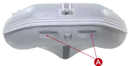
Grand 305 Bow

A と B の計4個のリフティングハンドルは、2人でボートを運搬するときに非常に便利。