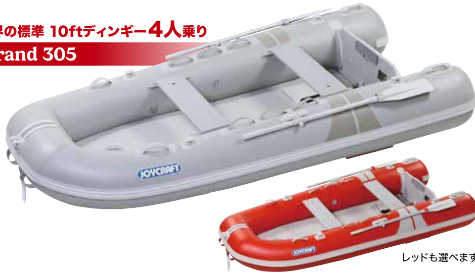
レッドも選べます