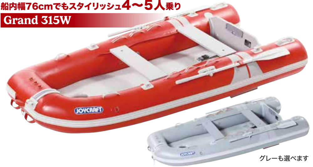
グレーも選べます