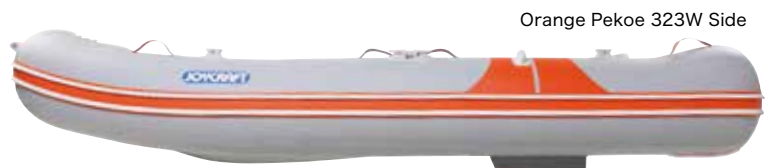
Orange Pekoe 323W Side