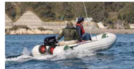
6馬力エンジン2人乗艇の走り