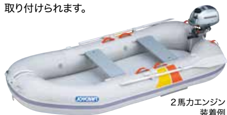
2馬力エンジン装着例

マジックマグ、FEM、TWMは、小さなトランサムボードがボート本体にしっかり固定されています。エンジンだけでなく、魚探センサーや竿受けなども取り付けられます。