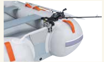
サオ受けをセット