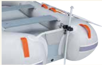
魚探センサーをセット