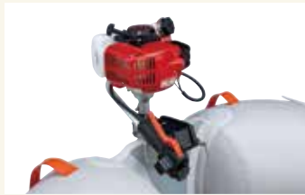
1.2馬力エンジンをセット

トランサムボードは、エレキや1.2馬力、2馬力エンジンの搭載はもちろん、フィッシングアイテムの取り付けにも便利です。