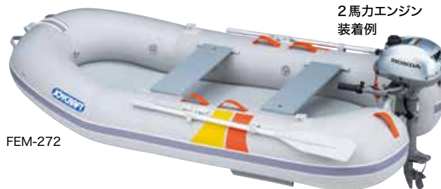
2馬力エンジン 装着例