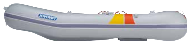
センターキール+ダイナキール