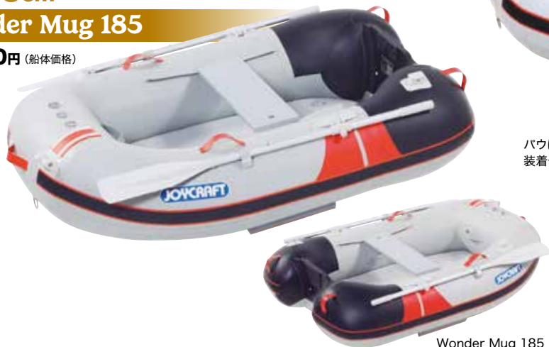
Wonder Mug 185